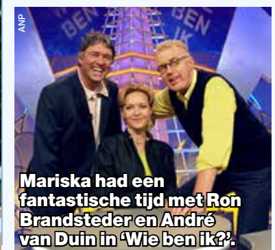
Mariska had een fantastische tijd met Ron Brandsteder en André van Duin in 'Wie ben ik?'

puzzel in elkaar. Dat de jury dat toen niet gezien heeft, heb ik als kwetsend ervaren. Wel ben ik blij dat mijn vader de positieve recensies voor Chicago nog net heeft meegemaakt. Een week na de première overleed hij en deze rol heeft het verwerken van dat verlies vergemakkelijkt.' Je hebt ook mooie jaren als presentatrice gekend. 'Van Wie ben ik? , als opvolgster van CAROLINE TENSEN , heb ik zeer genoten. Het was een feest