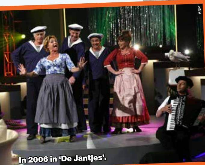
In 2006 in 'De Jantjes'.